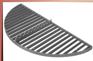
Решетка для удобства вспарывания мешка и выгрузки