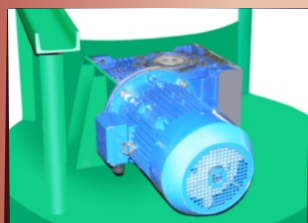
Надежный и мощный привод активатора