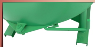
Удобное расположение шиберного затвора