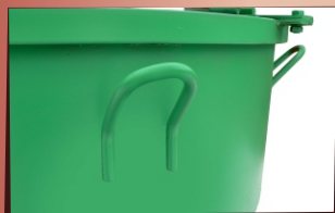
Надежная петля для строповки