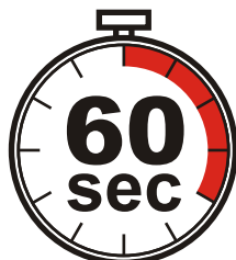
Время одного замеса